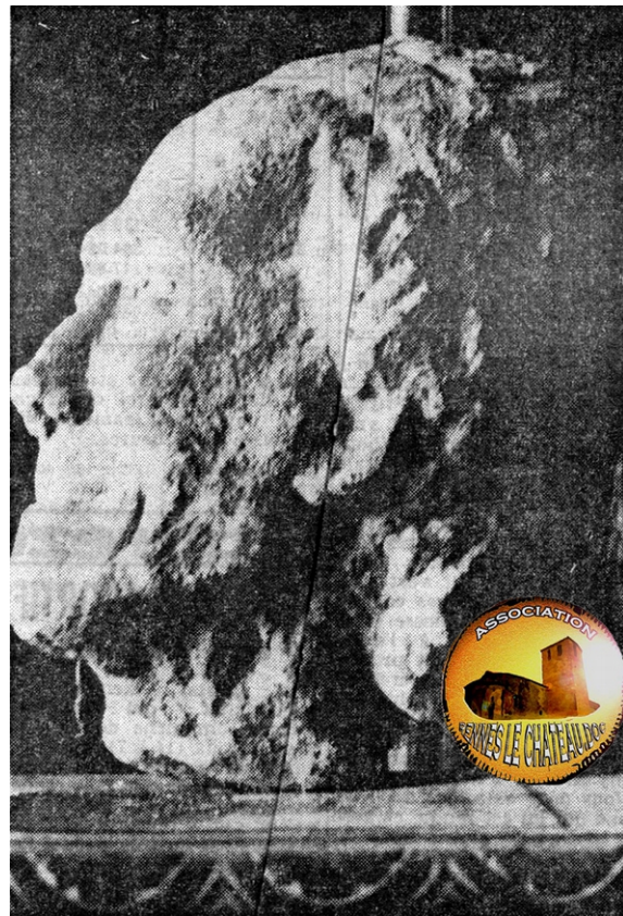
La Dépêche du Midi du 17 mars 1966